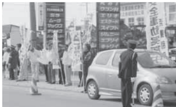
交通安全運動街頭啓発

浜頓別ライオンズクラブは、1970年の結成から50年を迎えようとしています。地域が直面している少子高齢化・人口減少は、クラブの会員増強にも影をおとしております。「元気印」の増強をめざし地域から奉仕の輪を更に広げるよう後力を続けていきます。