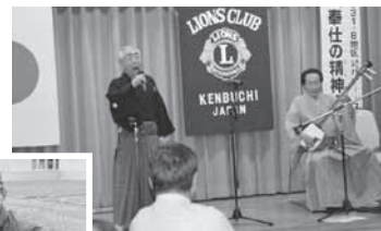
式典余興で民謡を披露