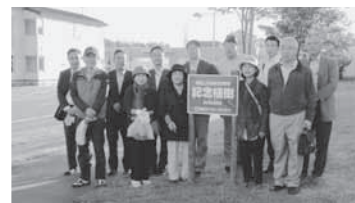
②記念植樹周辺清掃