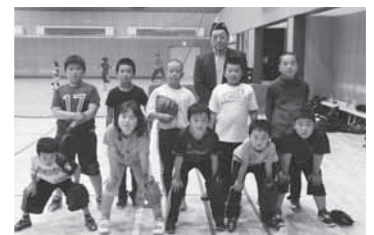
①野球スポーツ少年団贈呈

当クラブは、会員現在22名であり、一時期減少傾向にありましたが、役員員の努力により、現在の会員数まで増員しており今後共維持してまいります。今後は、これらの活動を基本に地域奉仕に貢献出来る事業を検討しクラブ活動の充実を図りながら会員ともども頑張っており参ります。