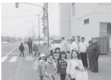
新入学児童の通学指導