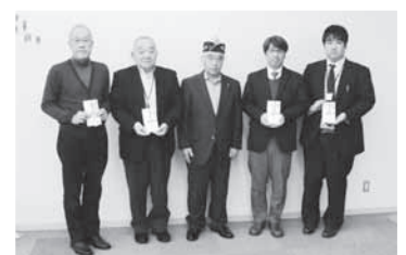
③社会福祉施設等への支援金贈呈